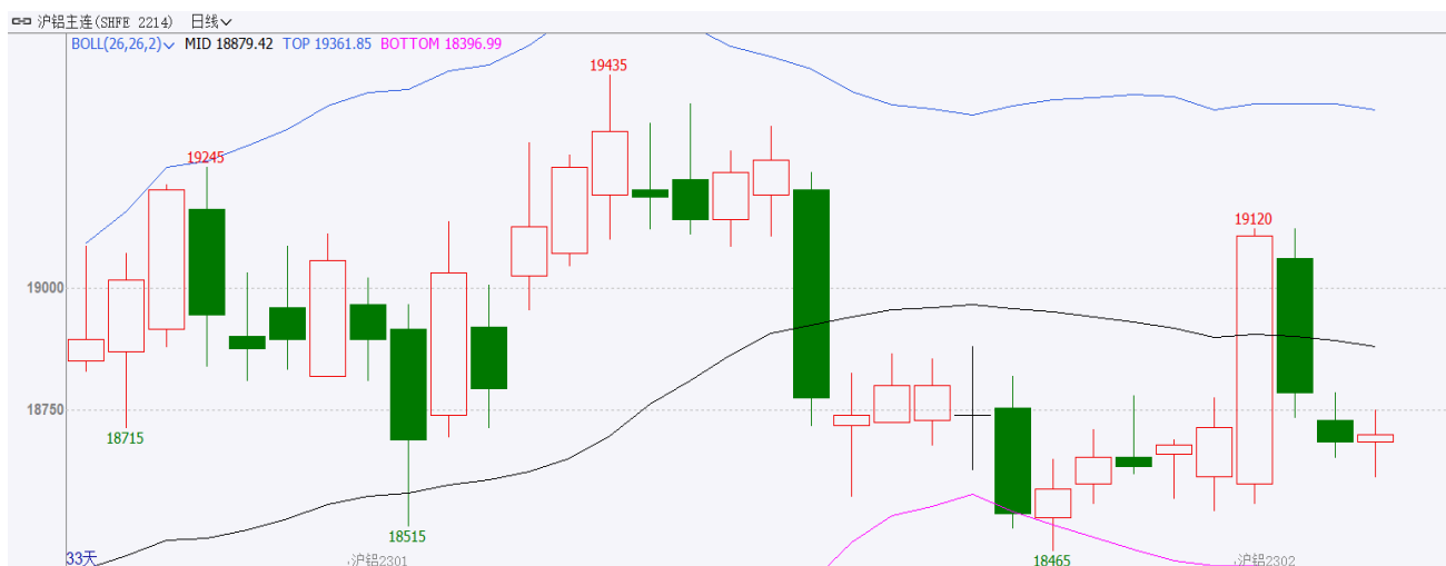
图表 1：沪铝主力合约走势图

12 月，沪铝主力开盘价为 19025 元/吨，收于 18700 元/吨，月跌 95 元/吨，或 0.51%，波动范围：18465~19435 元/吨。成交量减少 127.6 万手至 365.3 万手，持仓量减少 63195 手至 13.7 万手。