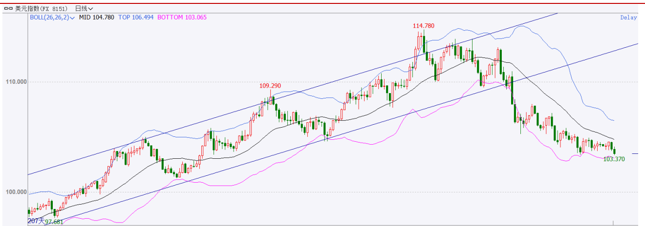
图表 2: 美元指数走势图

12月,美元指数继续走弱,开盘价106.2点,收于103.49点,月跌2.51点或2.37%,波动范围:103.37~106.06点。虽然美联储主席鲍威尔在12月发表了2023年会继续加息的鹰派言论,但美元指数却继续下跌,可能是市场对美国经济陷入衰退的担忧所致。