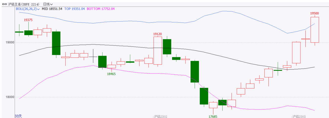
图表 1: 沪铝主力合约走势图