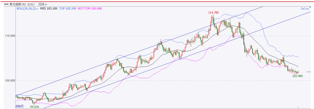
图表 2：美元指数走势图

1月9日，美元指数盘中跌幅超过0.3%，因市场预期美联储2月份加息力度进一步减弱。据CME“美联储观察”显示，美联储2月加息25个基点至4.50%-4.75%区间的概率为76.6%。美联储加息力度放缓，不利于美元上涨，弱势的美元利好铝价。