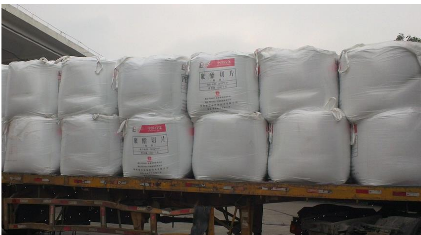
图表 4: 瓶片运输