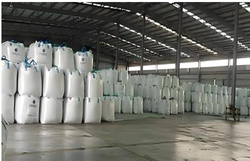
图表 3: 瓶片仓储